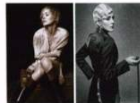
A SINISTRA: CAMICIA IN RASO DI SETA, SASCH. STIVALI DA CAVALLO, HERMÈS. A DESTRA: GIACCA DA FRAC IN RASO E FRUSTINO, HERMÈS. COLLANA DI CRISTALLI, CARLO ZINI. ORECCHINI PALACE COSTUME L.A.