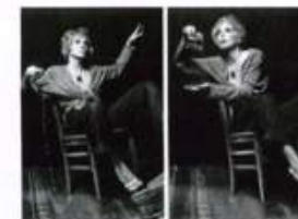
CARDIGAN DI LANA, FRENCH CONNECTION. PANTALONI GESSATI, PIAZZA SEMPIONE. SCARPE BICOLORE, GUIDO PASQUALI. CIONDOLI INSLATE.COM. SET DESIGNER ROBERT SUMRELL @MAGNET L.A. DIGITAL TECH CHRIS NOWLING OF THE BRIDGE. PRODUZIONE RAOU LAMELAS@FTI INC.