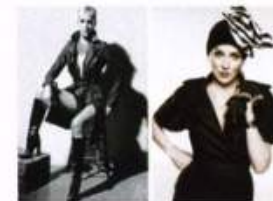
A SINISTRA: TRENCH IN NYLON, NAO TAKEKOSHI. STIVALI LOUIS VUITTON. A DESTRA: TAILLEUR FENDI. COLLIER, CAPPELLINO E GUANTI VINTAGE, PALACE COSTUME L.A.