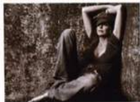
T-SHIRT 40 WEFT. JEANS TRUE RELIGION. SANDALI ROGER VIVIER. BERRETTO EXITO. STYLIST JESSICA PASTER @MAGNET L.A. MAKE-UP KRISTOFER BUKLER @ ARTISTS BY TIMOTHY PRIANO USING DIOR. HAIR ROD ORTEGA @ SOLO ARTISTS/REDKEN. MANICURE SANDY.