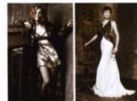
A SINISTRA: CAPPOTTO IN LANA A CHECKS, CLIPS. SOTTOVESTE DI RASO E PIZZO, YAMAMAY. A DESTRA: ABITO IN SETA CON BUSTIER RICAMATO A FIOCCO, DIOR BY JOHN GALLIANO.